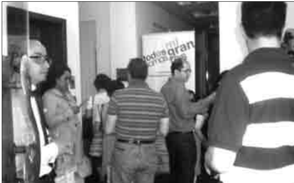
Ecuatorianos en el hall de ingreso para votar en la consulta popular.